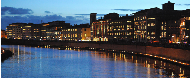
Luminara di San Ranieri, Giugno Pisano